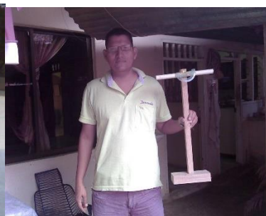
Figura 4. Profesor con Teodolito