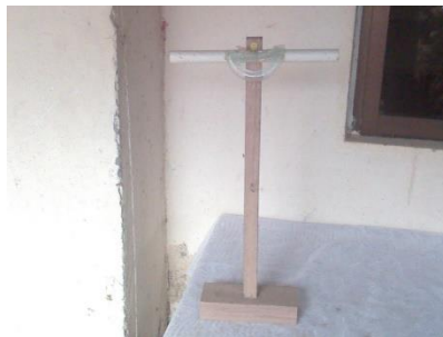
Figura 3. Instrumento de medicion

Es de anotar que tanto en la construcción del teodolito y medición del ángulo de elevación se pueden presentar errores, por lo cuál se debe usar en las conclusiones “ estimar la altura de ...”.