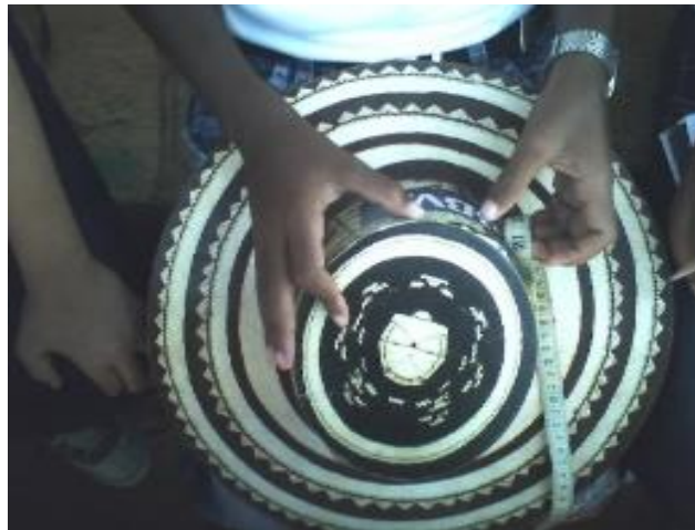
Figura 1. Ejemplo de medición del número pi

Recomendación: trabajar éste laboratorio en los grados donde inicien el concepto de números irracionales.